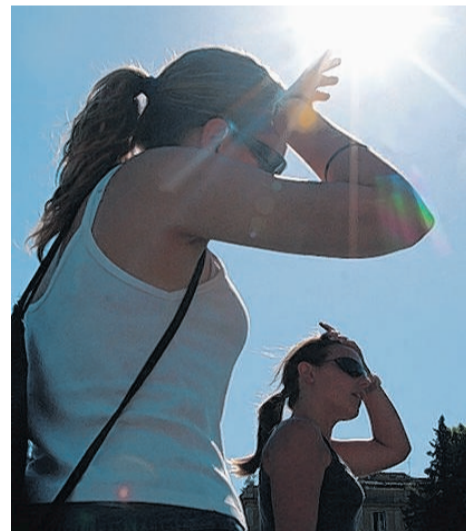
Im Sommer ist Schwitzen normal, doch manche Menschen schwitzen krankhaft.

„Dann sprechen Mediziner von der sogenannten Hyperhidrose, einer krankhaften übermäßigen Schweißproduktion des Kör-