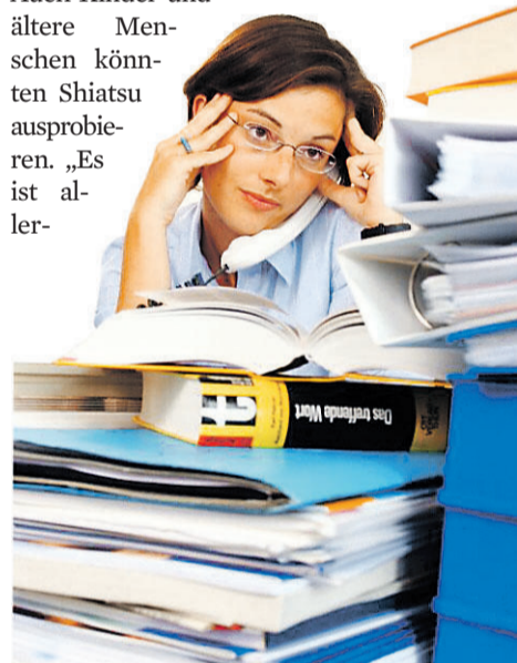
Shiatsu hilft etwa beim Abschalten vom täglichen Stress.

Shiatsu ist dabei grundsätzlich für alle Menschen geeignet, wie Klattenberg sagt. Auch Kinder und ältere Menschen können Shiatsu ausprobieren. „Es ist aller-