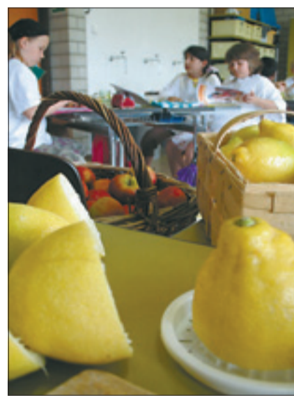
Die Anne-Frank-Schule in Fellbach war Science-Kids-Projektschule. Sauer