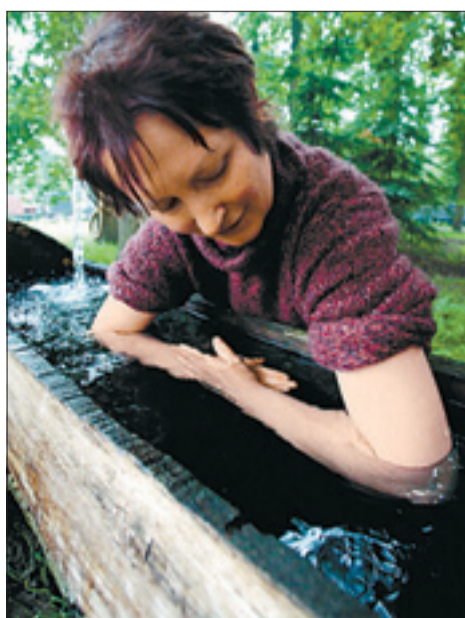
Armbad nach Kneipp

■ Wassertherapie: Durch die Kombination von kalten und warmen Behandlungen wird der Körper abgehärtet und besser durchblutet, die Gefäße werden trainiert, der Kreislauf wird angeregt, und Schmerzen werden gelindert. Krankheitserreger werden so aus dem Körper ausgeschwemmt. Durch die bessere Durchblutung wird das Immunsystem gestärkt und werden Entzündungen gehemmt. Heißes Wasser entspannt zudem